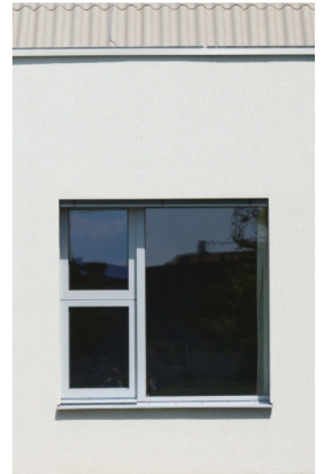
Holz- & Holz-Alufenster bieten hervorragende bauphysikalische Eigenschaften