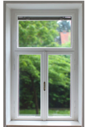
Kastenfenster werden mit dem ZP-System® saniert oder von Grund auf nachgebaut