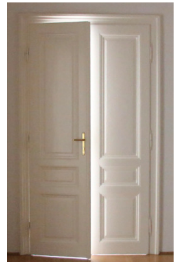
Brandschutztüren in klassischer Rahmentür-optik, optional auch mit Panikbeschlägen