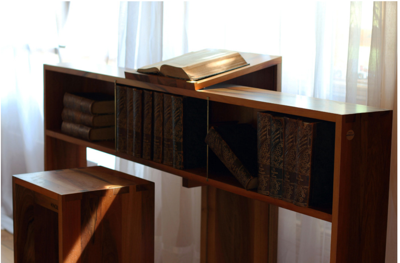
Bücherorgel wurde speziell für die 30-bändige Ausgabe der Brockhaus Enzyklopädie nach einem Entwurf von Künstler Peter Knoll angefertigt.