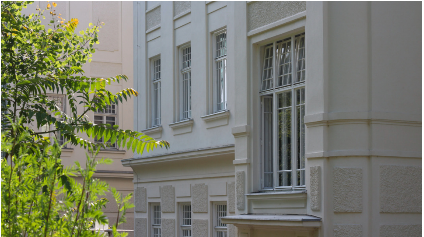
2010 LKH-Univ. Klinikum Graz, Neurologie: Sanierung u. Nachbau 290 Kastenfenster u. -türen